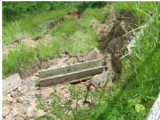
図-2.3.3 B小学校校庭南側の法面崩壊