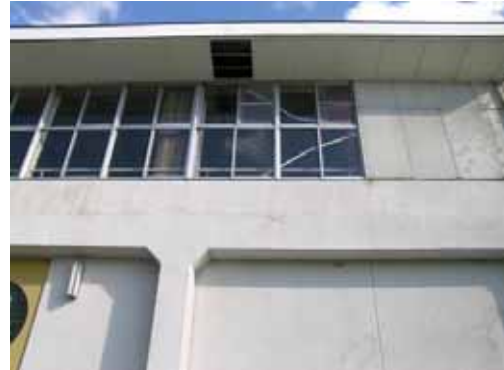
(b) 軒天落下及びブレース座屈