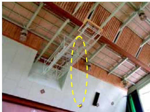
(c) バスケットゴール損傷（斜材が垂れ下る）