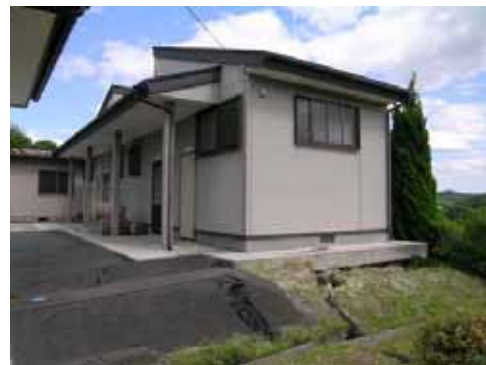
(b) 南側斜面擁壁上部の建物（基礎下に地割れ）