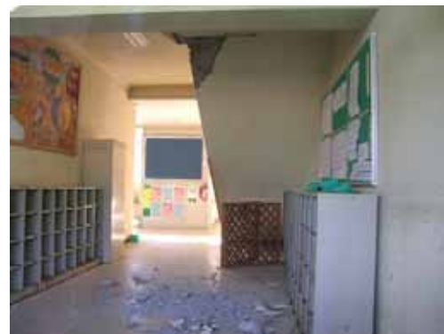
(d) 1階階段上部の損傷