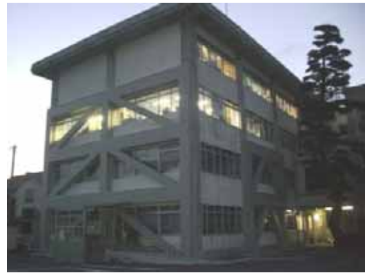
(b) 大崎市役所（無被害）