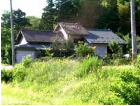
(a) 住宅の棟瓦の落下