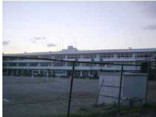
図-2.3.26 I 中学校新校舎外観

大崎市古川のI中学校においては、RC造3階建ての新校舎（築年不明）の東側妻壁脚部にごく軽微な破損が見られた。また、現在は使用されていない木造2階建ての旧校舎（築年不明）の棟瓦の落下が見られた。