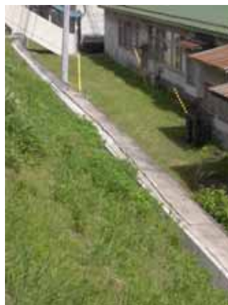
(c) 北側最上段の擁壁頂部のはらみ出し