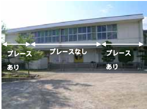
(a) 体育館外観及びブレース配置