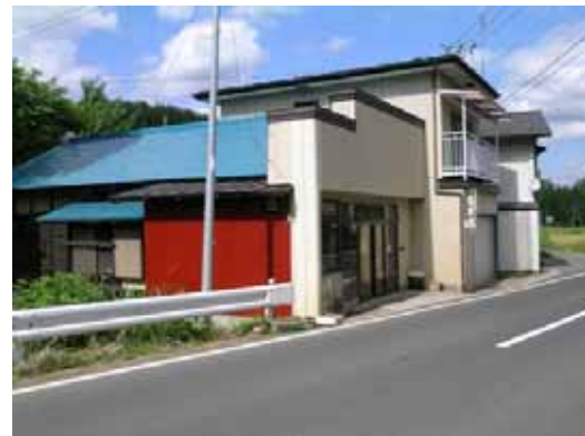
(b) 向かいの店舗併用住宅（要注意判定）