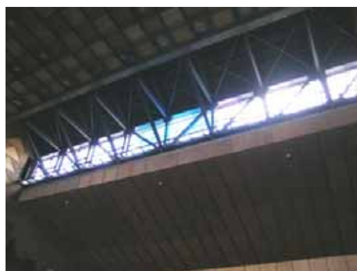
(b) 高窓部分内部鉄骨トラス