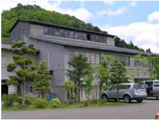
(a) コミュニティホール外観