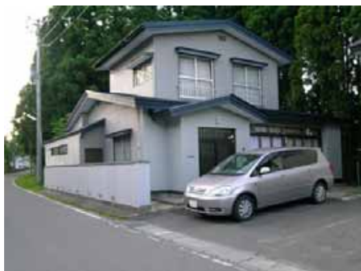
(c) 付近の住宅（無被害）