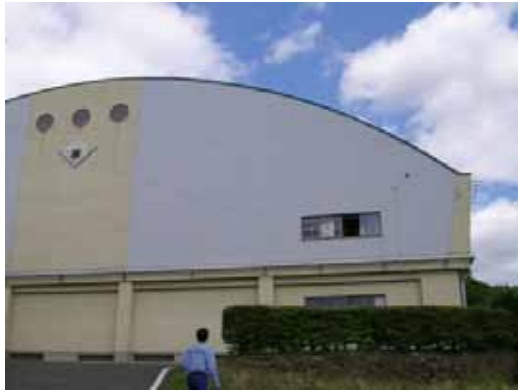
(a) 体育館妻面の窓ガラス破損