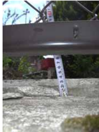
(b) 水路際の地盤の沈下