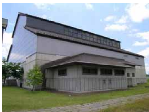
図-2.3.8 D建築物北面（高窓に被害なし）