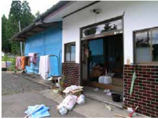
(a) 外壁損傷及びサッシの脱落