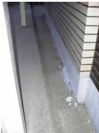
(a) 新校舎東側妻壁脚部の破損