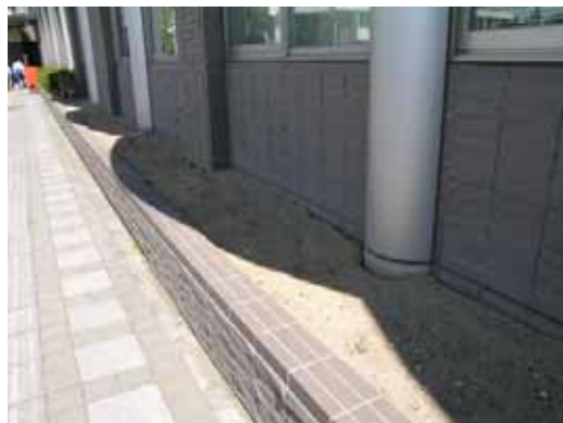
(b) 建築物脚部の地盤との隙間