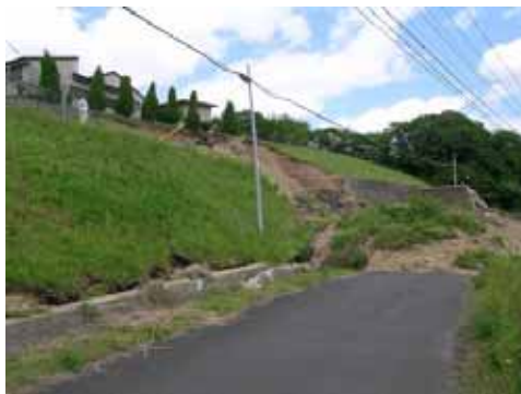
(a) 南側斜面擁壁の崩壊

栗原市鷺沢のG工業高校では、敷地南側斜面の盛土擁壁で大規模な崩壊があり、擁壁上部の敷地で地盤に幅10cm程度の亀裂が1メートルほどの間隔で2箇所発生し、建物基礎下に隙間ができる状態となった。敷地は切土・盛土によって4段に造成され、それぞれ盛土端部で軽微な地割れが見られた。また、最上段の擁壁頂部には、はらみ出しを生じていた。体育館では妻面（西側）の窓ガラス1か所及び北面の窓ガラス1か所の破損、ステージ脇の2階天井板の一部落下があった。