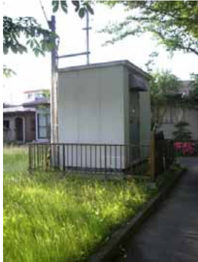
図-2.3.23 強震計設置状況（三日町公園）