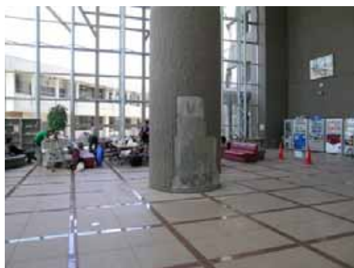
(d) 内部柱の仕上げタイル剥落