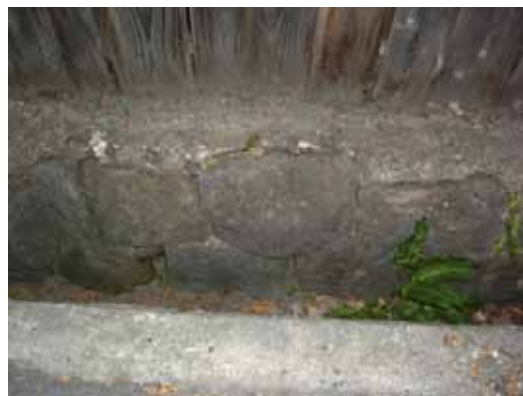
(b) 擁壁モルタルはがれ