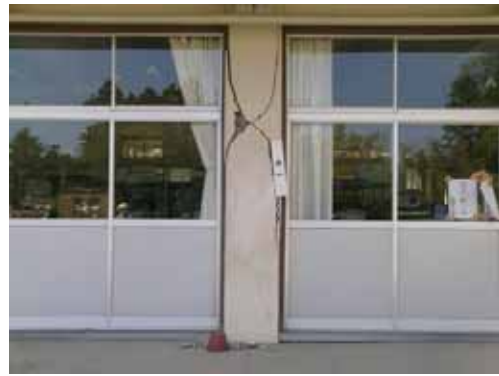
(b) 1階柱のせん断破壊