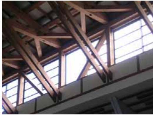
(b) 高窓サッシ脱落部の内部小屋組