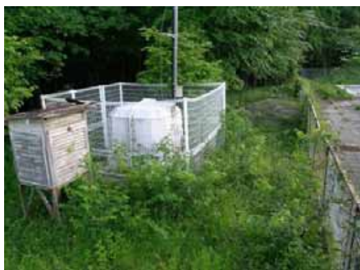
(a) K-net鳴子観測点（鬼首）左は傾斜地となる

観測点の同一敷地内にある旧中学校の校舎は木造平屋建てであり、外観上、特段の被害は見られなかった。また、旧中学校の北東側に木造住宅が数件あるが、いずれも特段の被害は見られなかった。