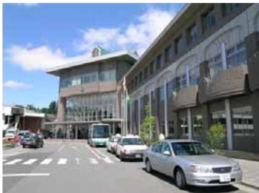
(a) A 建築物外観

栗原市築館のA建築物では、建築物周囲の間隙（5 cm程度）、内外の柱仕上げ材（タイル）の落下、内装亀裂等の軽微な被害が確認された。