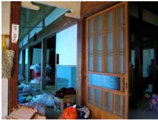
(c) 同住宅内部（特に躯体損傷なし）