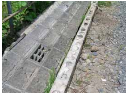
(b) 同詳細 鉄筋は見当たらない