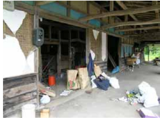
(b) 同住宅牛小屋の土壁剥落