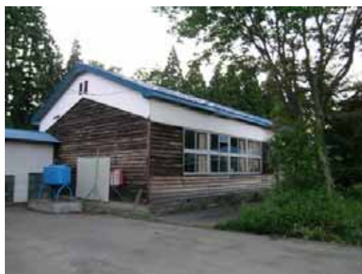
(b) プール北西側にある木造校舎