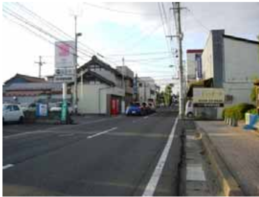
(a) 三日町公園西側市街（無被害）