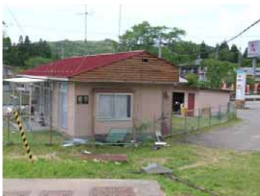
図-2.3.11 栗駒松倉地区の住家被害（妻壁仕上げ剥落）

栗駒沼倉上滝の原にあるF建築物では窓サッシの脱落があり、その向かいの2階建て木造住宅で窓の損傷がありシートが張られていた。また、これと隣接する伝統的構法の住宅では、サッシの脱落、土壁の剥落等の被害があったが、残留変形は小さく、木造躯体の損傷は確認されなかった。また、同敷地内で礎石の上に土台を流した小屋で、壁量が多いこともあり、土台から上が滑動したのみで上部構造の被害がほとんどない建物もあった。また、その近隣では、補強鉄筋の入っていないと見られるブロック塀の倒壊や、石碑の基部を囲む擁壁の崩壊、水路際の地盤の沈下（2～3 cm程度）が確認された。