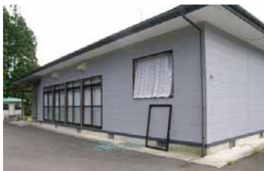
(a) 建築物F（窓サッシ脱落）