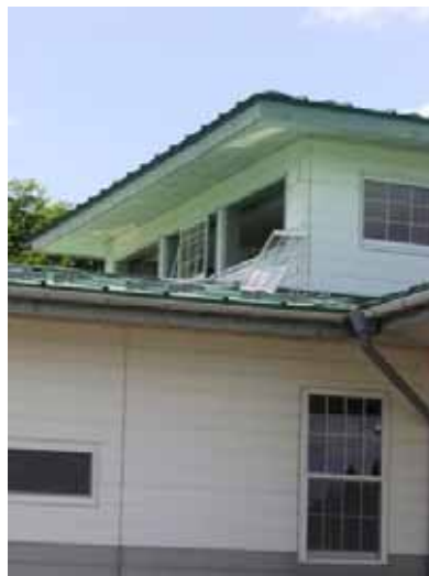
図-2.3.4 B小学校に隣接する木造建物の2階サッシの落下