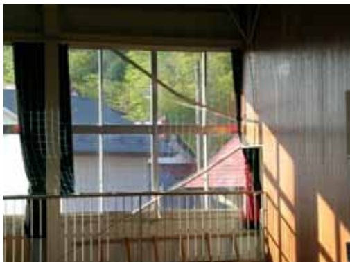
(c) ブレース座屈（内部より）