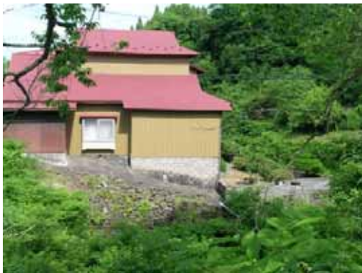
(a) 擁壁の亀裂があった住宅

鶯沢南郷の鉛川沿いの住宅で、川側の地盤の擁壁に亀裂が入り、応急危険度判定で要注意とされた例があった。川を挟んだ向かい側（西側）の町営住宅の敷地にも亀裂が認められた。道路対面（北側）の店舗併用住宅も要注意の判定であるが、外観上損傷等はなく、詳細は不明である。