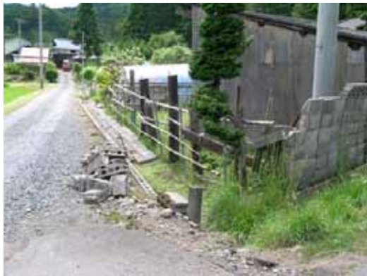
(a) ブロック塀の倒壊