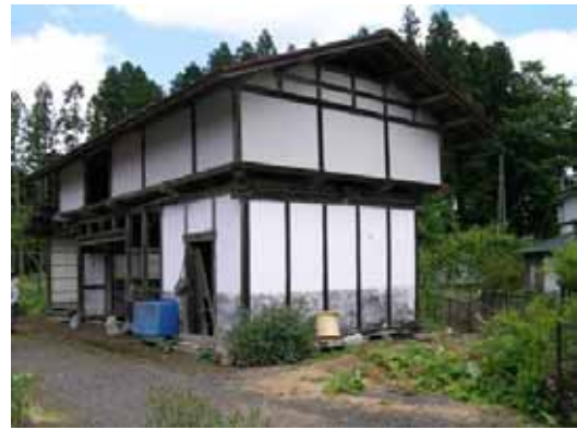
(d) 隣接する小屋（滑動してほぼ無被害）