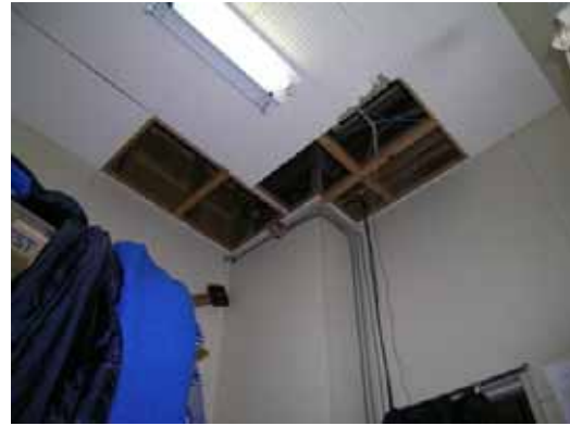
(b) ステージ脇2階天井板の落下