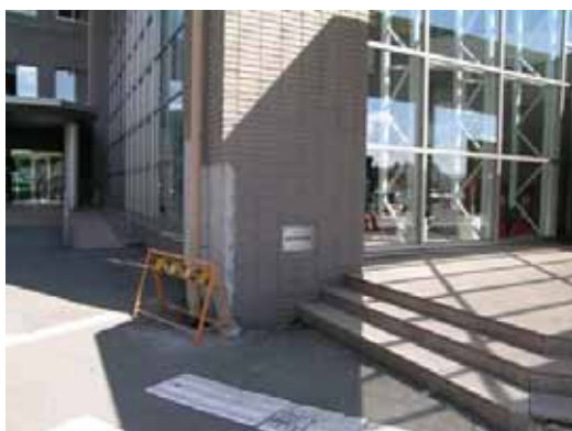
(c) 外装タイルの剥落