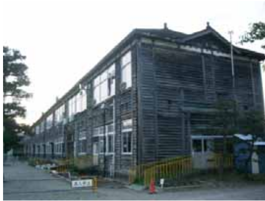
図-2.3.28 J小学校旧校舎（北校舎）の外観（無被害）

大崎市古川のJ小学校は、旧校舎として築80年程度の2階建て木造校舎が2棟建設されている。うち南側の校舎（昭和6年）は木造の補強壁を外構面に張り出して設置する耐震補強が行われており、現在も使用されているが、無補強の北側の後者（昭和4年築）を含め、いずれも外観上の被害は見られなかった。