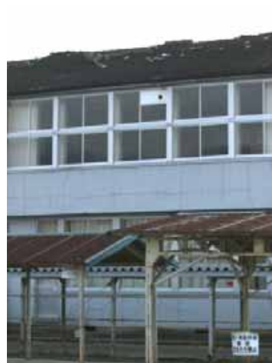
(b) 旧校舎の棟瓦落下