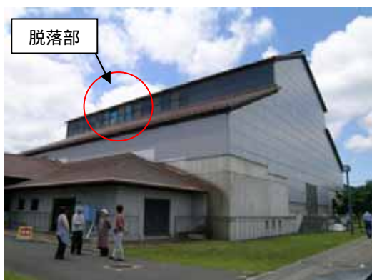
(a) D建築物外観及び南側脱落部

栗原市栗駒岩ヶ崎にあるD建築物において、南側高窓のサッシの脱落の被害があった。応急危険度判定では要注意の判定である。D建築物は体育館（練武場）として利用されており、高窓が設けられた部分を鉄骨トラスとして張り間方向に大きなスパンを飛ばしており、振動による変形があったものと推定される。構造的に対称に高窓が設けられている北面ではサッシの脱落等の被害は確認されなかった。