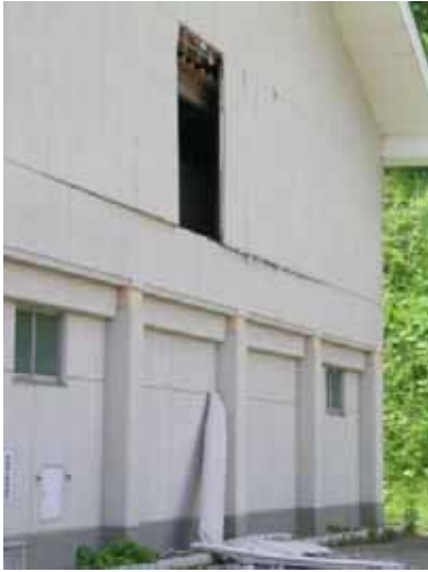
(a) 西側妻面の外装ALCパネルの落下