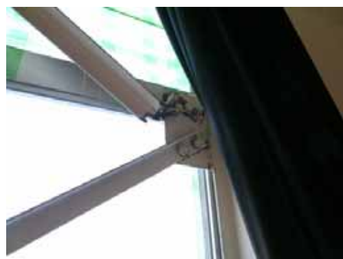
(d) ブレース端部接合部の破壊