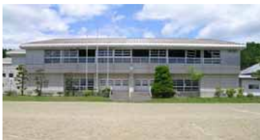
図-2.3.5 C 小学校体育館南側全景

窓ガラスの破損及び軒天の外装材の落下は、南北両面で同様に発生している。3年前の地震（平成17年宮城県南部地震と思われる）においても同様の被害があったとのこと。サッシの上部は、軒のH形鋼には直接取り付けられておらず、軒先に設けた軽量鉄骨下地の垂れ壁につながっており、当該部分の面外剛性の不足によりサッシ上部が面外に振動したり、軒裏の金具が大きく変形した結果、これらの被害につながったと推定される。