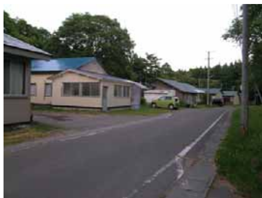
(d) 付近の住宅（無被害）