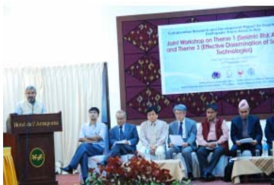
7.6.1 ワークショップ発表風景