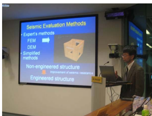
7.7.2 ビデオ会議システムによるプレゼンテーション