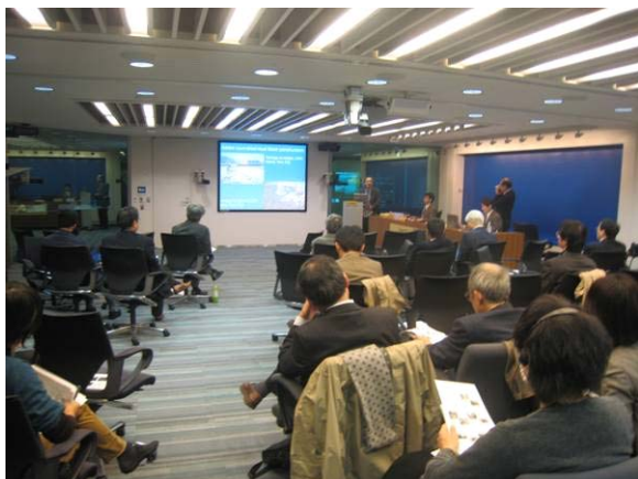
7.7.1 ワークショップ会場風景