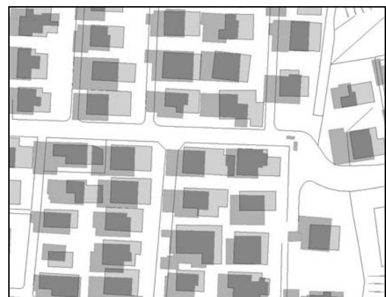
図 3 建物形状同士による同定の例