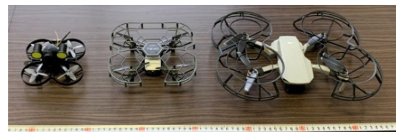
(A)産業用マイクロドローン (B)ホビー用マイクロドローン (C)小型ドローン