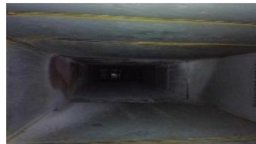
天井内ダクト(高さ35cm×幅90cm)