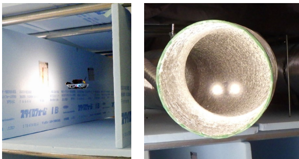
写真3 マイクロドローンの飛行状況