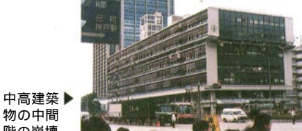
中高建築物の中間階の崩壊