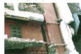
梁と柱の接合部の被害例で、梁端部の溶接部分で破断