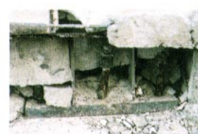
柱脚を基礎に固定するアンカーボルトの抜け出し