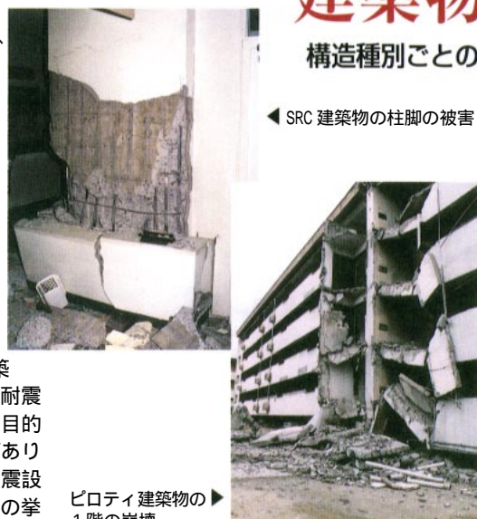
SRC建築物の柱脚の被害