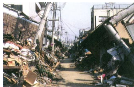
建築物全体が崩壊した木造住宅

今回の地震では、木造住宅に甚大な被害を出し、木造住宅の倒壊により多数の犠牲者を出しました。崩壊した木造住宅は比較的古いものに多く、瓦屋根に葺き土を有するため屋根重量が大きく、これに対して水平抵抗要素となる土塗り壁の耐力が小さいことが被害の原因となっていました。また、部材の仕口におけるほぞの掛かりが小さく、緊結が十分に行われていなかったものでは建築物全体が崩壊したものもありました。一方、比較的新しい住宅で設計、施工の適切なものは、一般に被害は比較的小さいようでしたが、耐力壁の配置が不適切なものや壁量の不足しているもの、接合部の緊結が不適切なものなどでは倒壊などの被害を出したものもあります。木造住宅の歴史は長く、現行の耐震レベルに達しないもののストックもかなりあることが想定され、今後これらの耐震診断、耐震改修に関する検討が必要です。