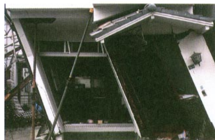
大きく傾いた間口の狭い住宅