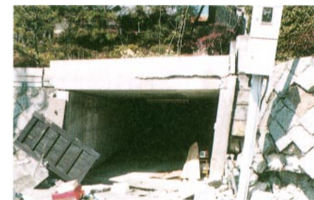
宅地盛土の移動による変状

建築物を支える基礎・地盤に、これまでの地震では経験しなかった多くの被害が発生しているとの指摘があります。基礎には直接基礎(基礎を堅い地盤の上に載せて建築物を支える)と杭基礎(堅い地盤まで杭を伸ばして建築物を支える)があり、直接基礎の場合には、基礎下の地盤が変状をきたして、沈下を起こす場合がほとんどです。地盤の変状の原因には、地盤の液化化や圧力の増加による地盤の塑性化(変形したまま元に戻らない)があげられます。杭基礎の場合には、杭や基礎梁の直接的な破損のほか、杭先の地盤に起因する被害があります。杭先の地盤の変状は、杭先端圧力の増加や施工上の問題、杭の破損の原因には、過大な外力の他、周辺地盤の側方流動(地盤が重力の作用によって、側方に移動する現象)があります。宅地の被害も、斜面の移動に起因したものと擁壁の被災に伴ったものなど、数千箇所に達しました。