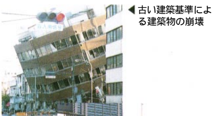
古い建築基準による建築物の崩壊

このような被害の特徴から、古い耐震基準による建築物、特に中高層建築物は、その地震に対する性能を診断(耐震診断)し、必要なら耐震性能の向上を目的とした補強(耐震改修)を施す必要があります。またピロティ形式の建築物の耐震設計、耐震診断、耐震改修には、建築物の挙動を正しく正確に考える必要があり、SRC造では内蔵鉄骨に引張応力が生じる場合の設計に注意が必要です。