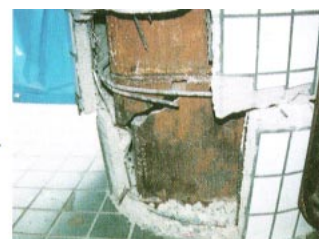
鉄骨の柱の継手部分で溶接箇所から柱の鉄骨にかけて破断