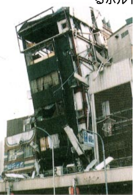
筋かいが接合部で破断し、建物の上階部分が前面に傾斜