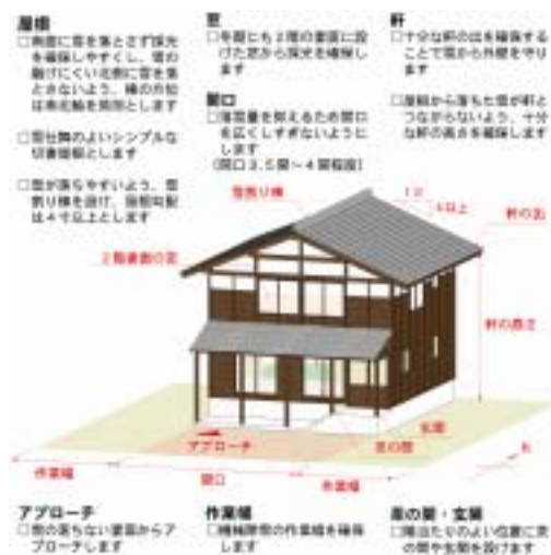
雪処理アイデア集

本格的な復興はまだ始まったばかりであるが、最後に現代生活に適応しながら山古志の風景をよりよくなる復興住宅の建設による生活再建、集落再生を記念するものである。