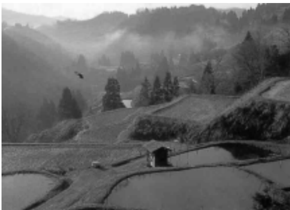
棚田の美しい山古志の風景